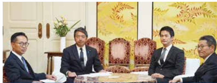
立憲民主党との幹事長・国会対策委員長会談(11月1日)