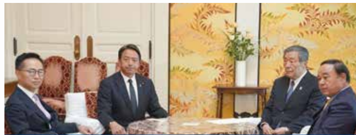
自民党との幹事長・国会対策委員長会談(10月31日)

これに先立ち、自民党、立憲民主党、日本維新の会、公明党の各党と幹事長・国対委員長会談、自民党、公明党とそれぞれ政調会長会談を行い、政策や法案などの案件ごとに協議することを確認しました。国民民主党は、衆議院選挙で掲げた政策の実現に向け全力で取り組んでいます。