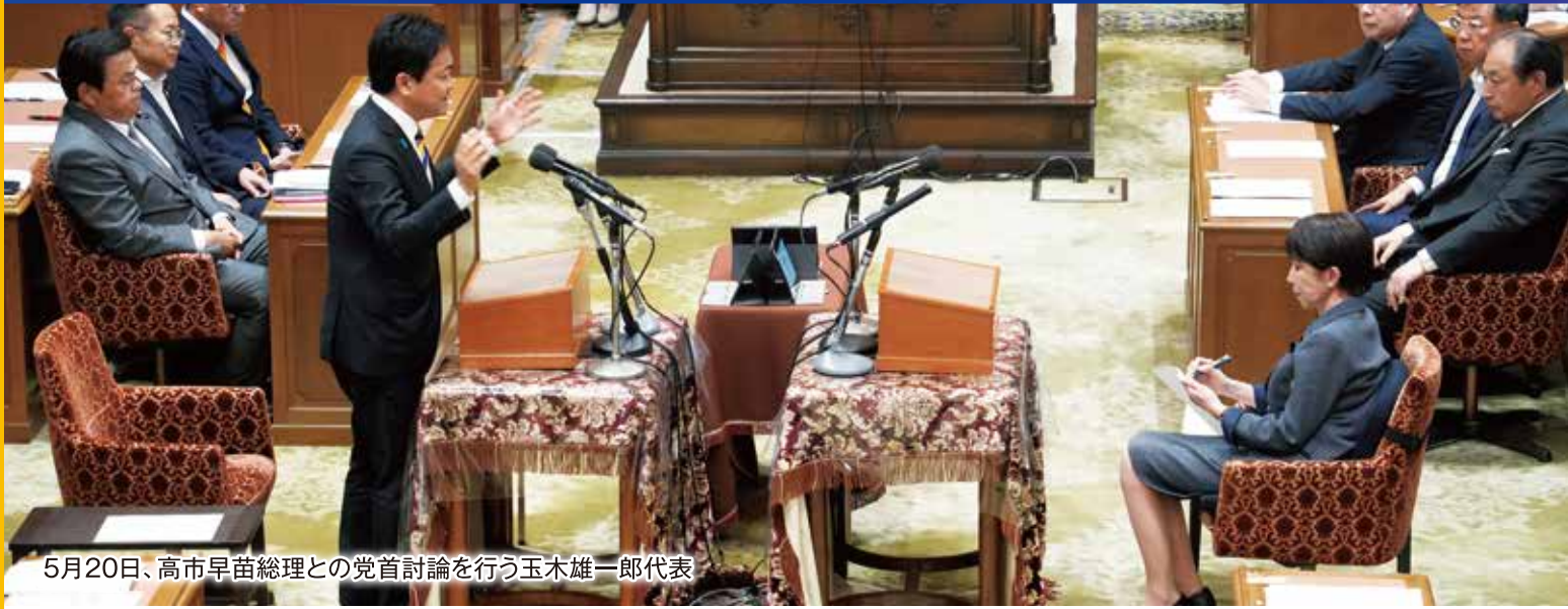
5月20日、高市早苗総理との党首討論を行う玉木雄一郎代表